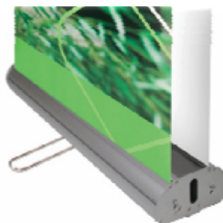
Pied stabilisateur central

Le kit comprend : le carter, les rails supérieurs clippants, le mât à élastique en 3 parties et le sac de transport.