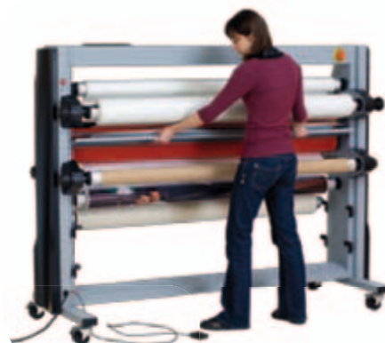
La table de sortie est amovible, vous choisissez ou non de son utilisation.