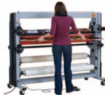
Installée, elle maintient les panneaux après le passage entre les rouleaux.