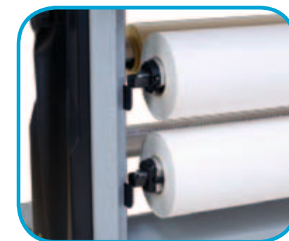
Stockage jusqu'à 4 bobines en position basse