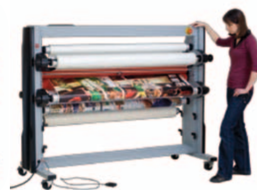
Table enlevée, les documents s'enroulent parfaitement sur l'axe du rembobinage.