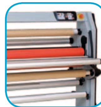
5 axes livrés, plus un axe de défilement

Nos axes sont conçus pour être utilisés sur l'ensemble des emplacements de la machine, dans un sens ou l'autre.