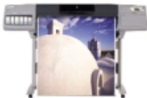
imprimante hp designjet 5500 (série 42 pouces)

Découvrez les solutions d'impression intelligentes assurant la simplification des tâches et la réduction des interventions de l'utilisateur.