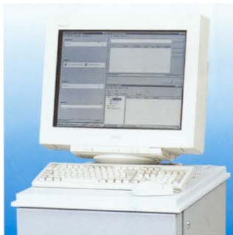
Le DDS 300 est compatible réseau, PC ou MAC, station de travail Unix.

Couplé à son scanner, ce traceur devient un copieur de plans numérique avec fonction agrandissement/réduction (zoom de 25 à 400%). Multicopie jusqu'à 99 exemplaires avec un seul passage de l'original.