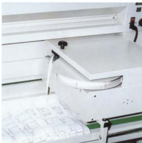
Option DIASTRIP pour la plieuse, permettant le collage automatique d'une bande d'archivage classeur sur le plan, après pliage.