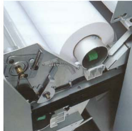
Alimentation automatique à partir d'une ou deux bobines de papier, calque ou polyester et "by-pass" pour alimentation manuelle en feuille à feuille.