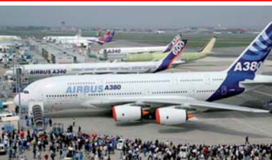
Aéronautique et Image Satellite